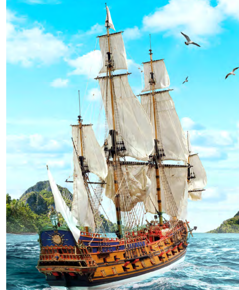
Conception : Infographie municipale de Lorient. Impression : Impression Olivier Lorient.

Musée d'art et d'histoire de la Ville de Lorient